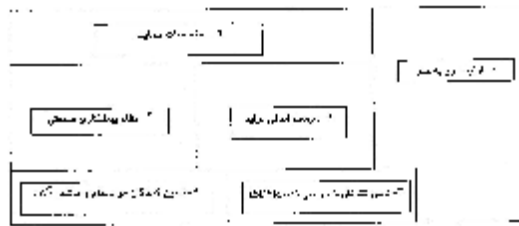
شکل (1): بخش‌های یک نقشه خوشه

یک مدل خوشه می‌تواند شامل شش قسمت باشد و همان‌گونه که در شکل (1) نشان داده شده، بیشتر به نظام اصلی تولید (واحدهای اصلی) که دیگر قسمت‌ها با آن مرتبط اند می‌پردازد.