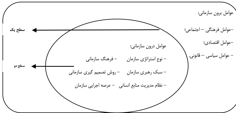
شکل شماره ۲- مدل کل نگرانه تحول نقش منابع انسانی در سازمانهای دولتی

ب- رویکرد فرایندنگری شایسته سالاری: رویکرد دیگری که در رابطه با شایسته سالاری مطرح است بینش فرایندنگری به این مفهوم است. چنانچه قبلا نیز بیان شد، در واقع شایسته سالاری به عنوان فرایند تلفیقی شامل گامها و محورهای شایسته خواهی، شایسته شناسی، شایسته سنجی، شایسته گزینی، شایسته گیری، شایسته گماری، شایسته پروری و شایسته داری می باشد. این رویکرد که به چرخه شایسته سالاری معروف است؛ در شکل گیری چارچوب نظری این تحقیق موثر بوده است. در واقع، در این پژوهش شایسته سالاری در قالب مولفه های مطرح شده به عنوان متغیر وابسته مورد توجه قرار گرفته است. همچنین عوامل درون سازمانی و برون سازمانی به عنوان متغیر مستقل در قالب شاخصها و معیارهای جدول شماره ۳ مورد توجه قرار گرفته است: