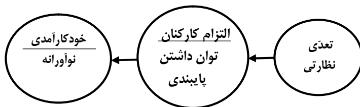
شکل شماره 1: مدل مفهومی پژوهش