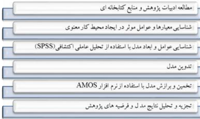
شکل شماره 1- مراحل انجام پژوهش